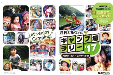
2017年度版 ラリーブック表紙