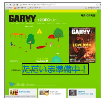
2016年、GARVYウェブサイト デザインリニューアル予定

※GARVYウェブサイトは2016年度より、新デザインへとリニューアルいたします。