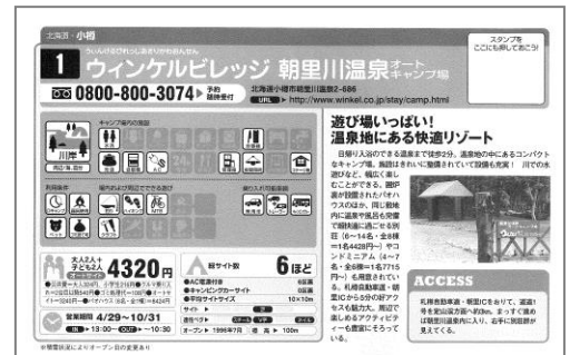
＜協賛キャンプ場紹介記事掲載例＞

キャンプ場紹介記事は『首都圏から行くオートキャンプ場ガイド2016』、『関西・名古屋から行くオートキャンプ場ガイド2016』に掲載の編集記事に準拠した内容となります。