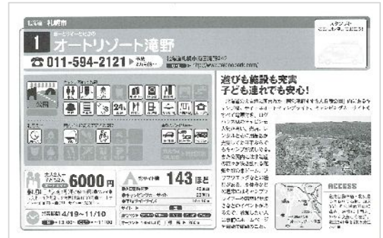
キャンプ場紹介記事掲載例